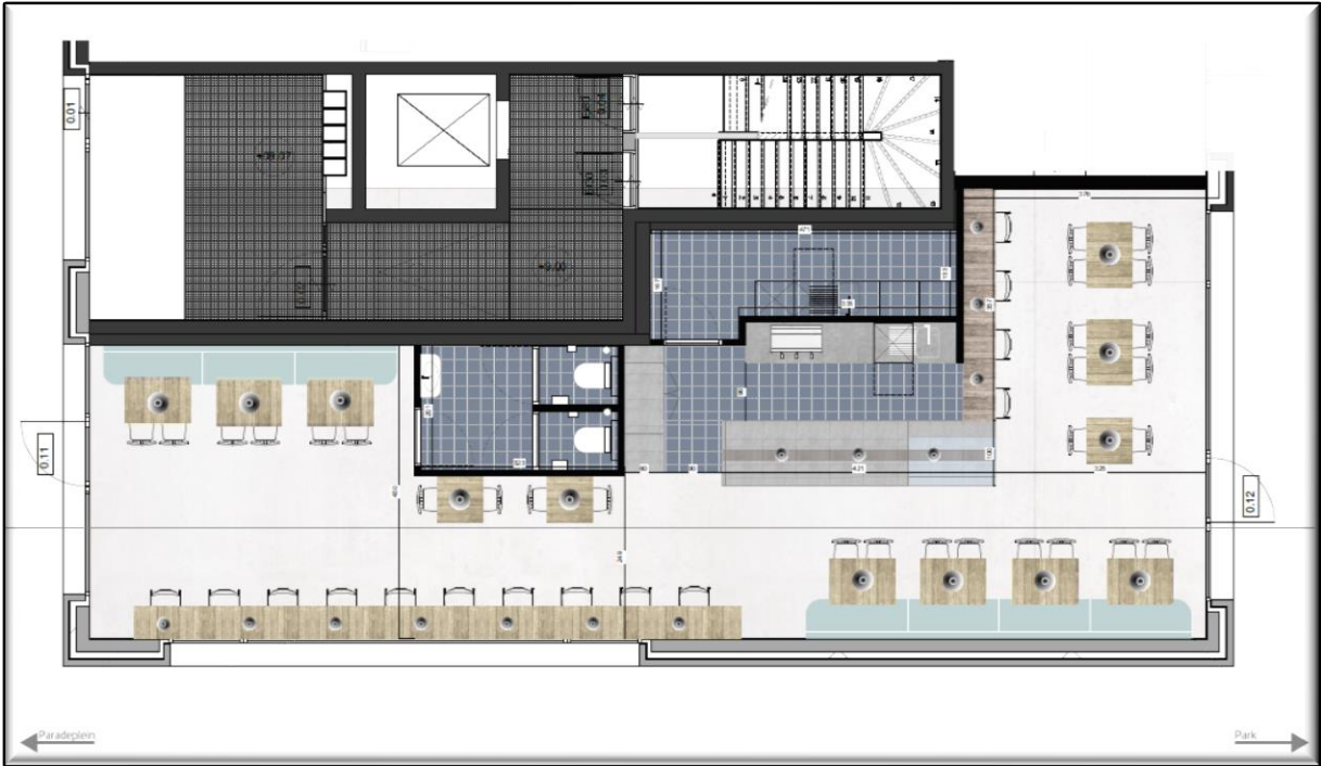
Grondplan mogelijke invulling horeca-concept