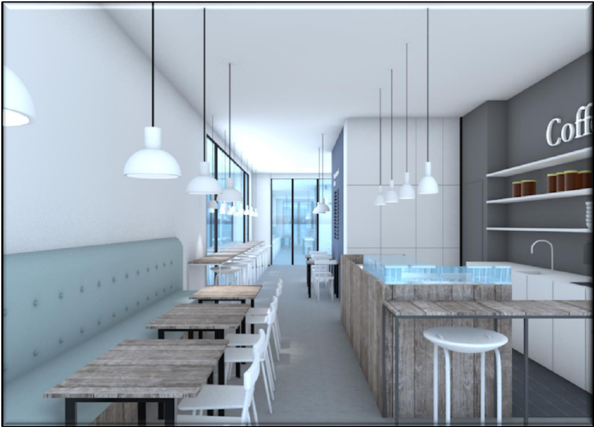
Visual mogelijke invulling horeca-concept